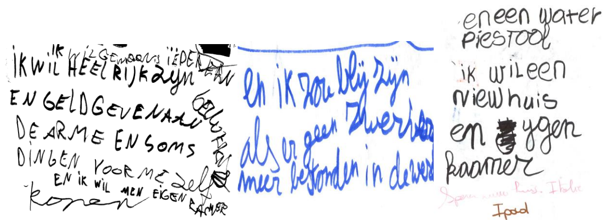
Figuur 4: Kindertekeningen recht op en in gezin (v.l.n.r.): 1. “ik wil heel rijk zijn en geld geven aan de arme en soms dingen voor mezelf en ik wil een eigen kamer kopen. Ik wil gewoon iedereen gelukkig.” 2. “En ik zou blij zijn als er geen zwervers meer bestonden.” 3. “En een waterpistool, ik wil een nieuwe huis en eigen kamer.”

Opvallend is dat alle kinderen via de verschillende bevestigingsvormen materiele noden aangeven. Deze noden variëren van multimedia en dure spullen tot het kunnen deelnemen aan buitenschoolse activiteiten (ballet..) en de wens geld te hebben voor betere accommodatie.