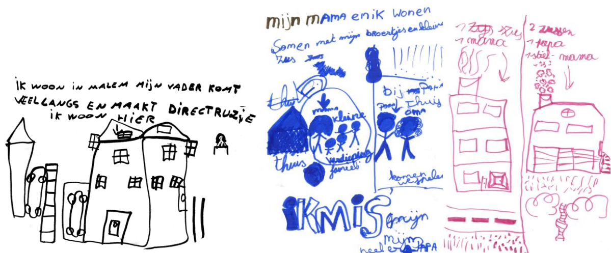
Figuur 1: Tekeningen bij het thema 'recht op en in gezin'. Kindertekeningen (v.l.n.r.): 1. "ik woon in Malem. Mijn vader komt veel langs en maakt directruzie. Ik woon hier." Tekening: twee woningen met een garage en twee wagens. 2. "mijn mama en ik wonen samen met mijn broertjes en kleine zus. Ik mis heel erg mijn papa". Daarbij wordt de gezinssamenstelling getekend: met links een mama met kleine kinderen ernaast. Rechts staat de papa ne de oma getekend. Tekening: verdeeld in twee delen. Links hoe de gezinssamenstelling is bij de mama (appartementgebouw met 1 zus en 1 mama) , en rechts de gezinssamenstelling bij de papa (een huis, 2 zussen, 1 papa, 1 stiefmama) . 3. Tekening is in tweeën gedeeld. Links staat het huis van de moeder en rechts de thuissituatie bij de vader.