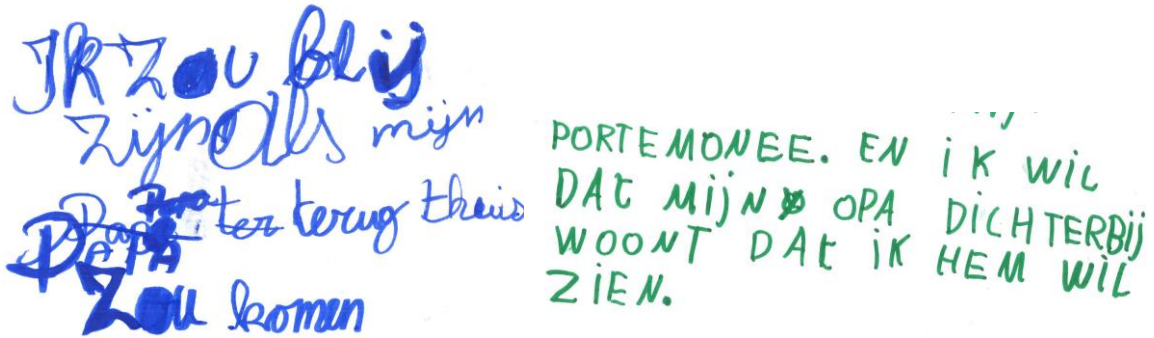
Figuur 2: Kindertekeningen 'recht op en in gezin'. (v.l.n.r.) 1. "Ik zou blij zijn als mijn papa terug thuis zou komen", 2. "(...) portemonee. En ik wil dat mijn opa dichterbij woont dat ik hem wil zien."

Kind 3: ja, mijn opa die woont in Turkije maar oma is dood en als haar wil zien dan moet ik op reis gaan of bel ik haar soms