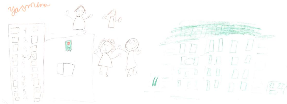
Figuur 3: Kindertekeningen recht op en in gezin (v.l.n.r.): 1. Er is een appartementsgebouw getekend en 4 personen. 2. Een appartementsgebouw.